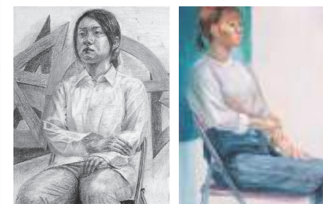
人物(左:鉛筆デッサン, 右:水彩)