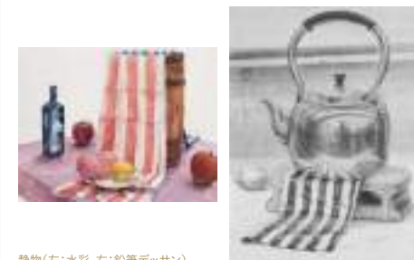
静物(左:水彩, 右:鉛筆デッサン)