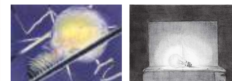
モチーフ構成(左:アクリルガッシュ, 右:鉛筆デッサン)