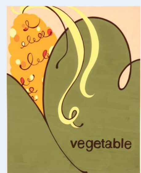
デザイン・工芸科授業風景