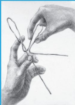
デザイン・工芸科