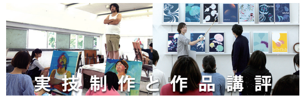
美技制作と作品講評

夜間部 | 6/6[月]→11[土] | 17:30→20:30 | 申込み締切日 6/5[日]19:00