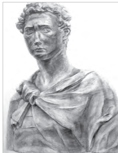
高校2年生 | 冬期講習・基礎科コース受講時