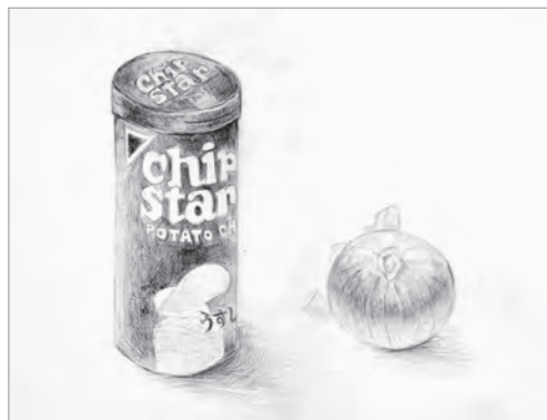
中学3年生 | 美術系高校受験科在籍時

高校3年生 | 3学期 多摩美術大学グラフィックデザ イン学科に現役合格！(女子美術)