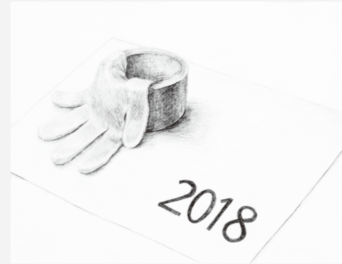
大宮光陵高校合格者(鉛筆デッサン・F6画用紙)