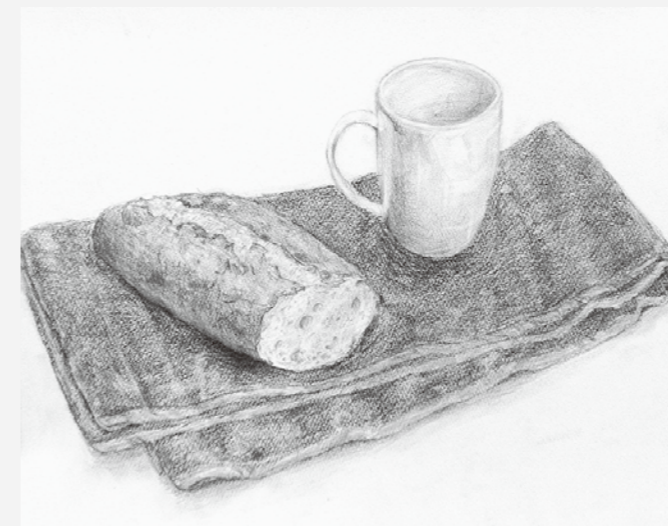
芸術総合高校合格者(鉛筆デッサン・F6画用紙)