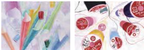
構成(左右とも:色彩構成)