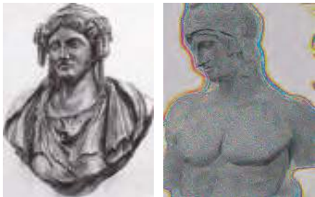
石膏像(左:木炭デッサン,右:鉛筆デッサン)