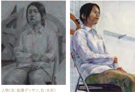
人物(左:鉛筆デッサン,右:水彩)