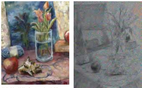
静物(左:鉛筆デッサン,右:油彩)