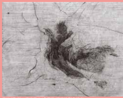
素描(構成) 東京芸大/多摩美/東京造形合格者