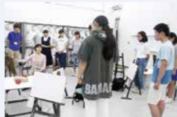
デモンストレーション

各課題についての内容や制作ポイント、必要な用具画材などについての説明や解説を初回授業時におこないます。課題によっては内容に合わせたゼミをおこない制作に必要な専門知識をはじめ、技術的内容までを分かりやすく解説します。