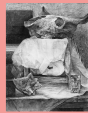
木炭デッサン(静物) 多摩美・武蔵美合格者