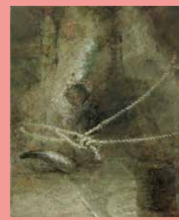
油彩(静物) 武蔵美合格者