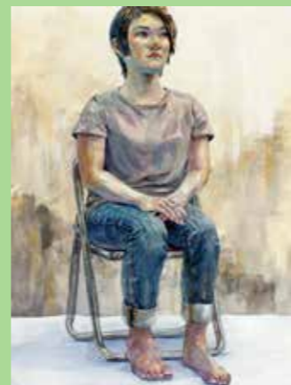
2018多摩美合格者 入試再現作品