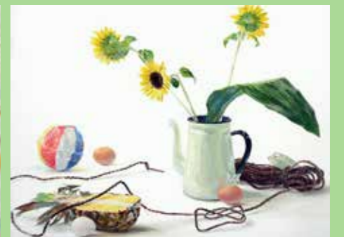
着彩[静物] 東京芸大合格者作品