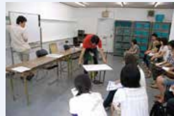
ガイダンス・ゼミ

各課題についての内容や制作ポイント、必要な用具画材などについての説明や解説を初回授業時におこないます。課題によっては内容に合わせたゼミをおこない制作に必要な専門知識をはじめ、技術的内容までを分かりやすく解説します。