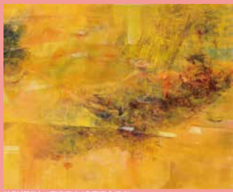
油彩(静物) 東京芸大/多摩美合格者