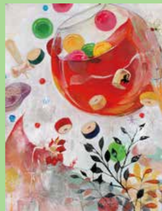
着彩[静物] 多摩美/武蔵美合格者作品