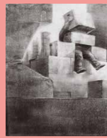
木炭デッサン(構成) 多摩美/武蔵美合格者