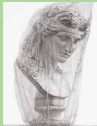
2018東京芸大合格者 入試再現作品