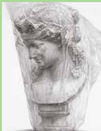
2018東京芸大合格者 入試再現作品