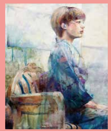
油彩(人物) 多摩美・武蔵美合格者