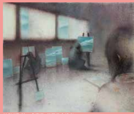
油彩(構成) 多摩美・武蔵美合格者