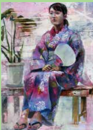
着彩[人物] 東京芸大合格者作品