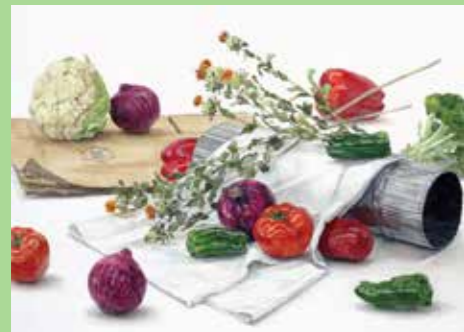
2018東京芸大合格者 入試再現作品

東京芸大・日本画専攻 芸大合格レベルの 2名合格! 実力が身につく。 一次試験合格倍率は1.75倍! 充実した指導内容の証です。