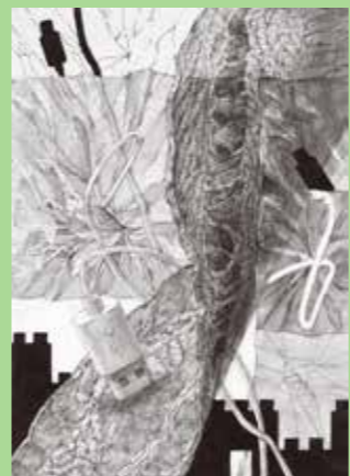
2018多摩美合格者 入試再現作品