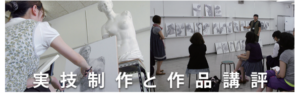
美技制作と作品講評