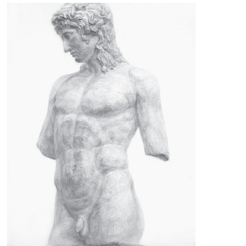
日本画科 鉛筆デッサン「石膏像」