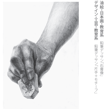
デザイン・工芸科 鉛筆デッサン「片手+モチーフ」