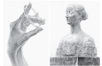
左 右 デザイン・工芸科 鉛筆デッサン「石膏像」 油絵・日本画・教育系 鉛筆デッサン「手+モチーフ」