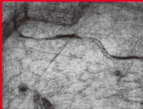
素描(室内風景) 東京芸大合格者