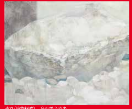
油彩(静物構成) 多摩美合格者