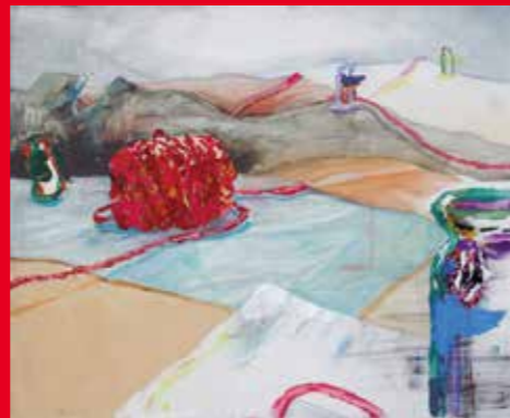
油彩(構成) 多摩美・東京造形合格者