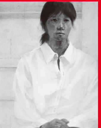
木炭デッサン(人物) 多摩美・武蔵美合格者