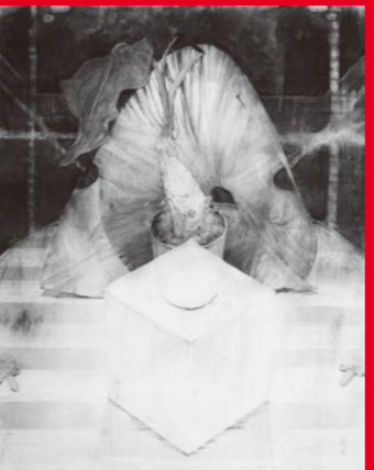
木炭デッサン(静物構成) 武蔵美合格者