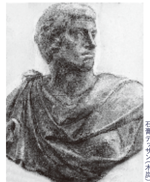
石膏デッサン(木炭)

木炭デッサン/木炭紙(3~4枚)、木炭デッサン用具 鉛筆デッサン/木炭紙判画用紙または白象紙、鉛筆デッサン用具