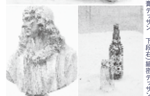
上段:静物デッサン 下段左:石膏デッサン 下段右:細密デッサン