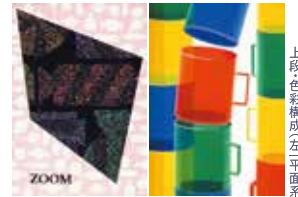
上段:色彩構成(左平面系、右立体系) 下段:静物デッサン

私大平面系/B3画用紙、鉛筆デッサン用具、 私大立体空間系/B3画用紙、B3ケント紙、鉛筆デッサン用具、色彩構成用具 芸大系/水粘土6kg、粘土べら、直定規、三角定規、霧吹き、雑巾